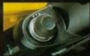
■ 曲のやみダフリー、クイックレスポンス

ジムニー55の装備には、曲のやみダがありません。運転のしやすい 大径ステアリング、行動半径を認める40リットル大型ガソリンタンク、快適な シートクッション、各種安全装備一挙にやさし、安全性も追求した設計 本位の設計です。 ※ラジオはオプション