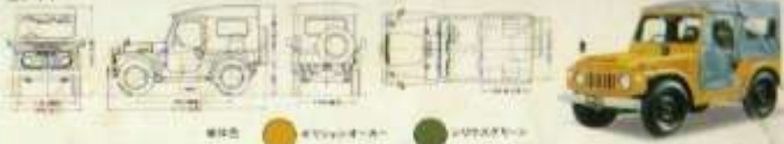
軽タイプ ●カラーオプション ●ボディオプション