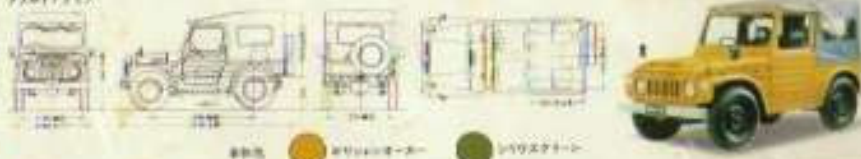
軽タイプ ●カラーオプション ●ボディオプション