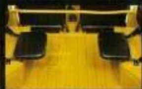
■ 高剛性のシートクッション、後部もたっぷり200kgの乗物が使えます。 他、ノーマルタイプ