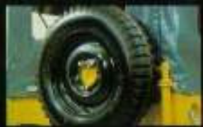
■ 公道のくらくらぶつたけ、コーナー時は車体の揺れも減ります。