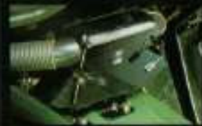
■ さらに拡大になったエンジン、乗り心地も向上