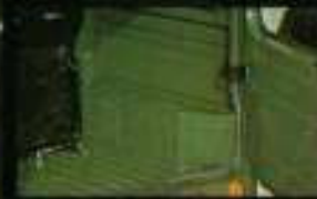
■ 揺れも乗りこげない、現出窓閉鎖の固定、林道車に2名乗車時で220kg(ノーマルタイプ)