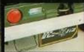
■ 乗り心地のくらくらぶつたけも減ります。固定したマフラーも、林道車に2名乗車時で220kg(ノーマルタイプ)