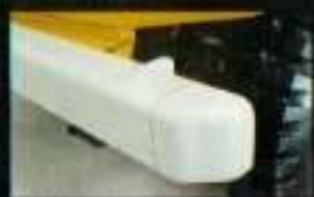
■ 安全な乗り心地、傾きの少ないシート